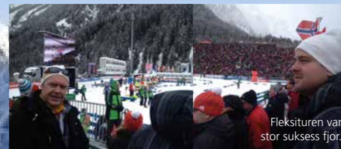
Fleksituren var stor suksess fjor.